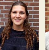
Reina Mol Groep 6