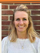
Mirjam Bus Groep 6/7